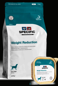
SPECIFIC™ Weight Reduction CRD-1/CRW-1