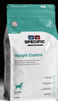
SPECIFIC™ Weight Control CRD-2