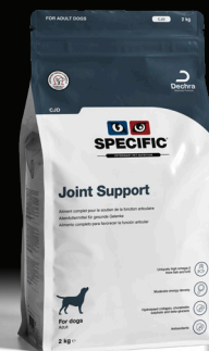
SPECIFIC™ Joint Support CJD